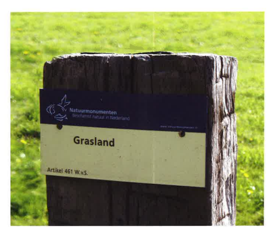
Boeren hoeven bij Natuurminumenten niet aan te kloppen voor mestplaatsingsruimte

In ruil voor het natuurbeheer dat past bij de terreinbeheerder, willen de agrariërs graag meer flexibiliteit in de afspraken: waarom wachten met maaien als er geen weidevogels meer op een perceel zitten?