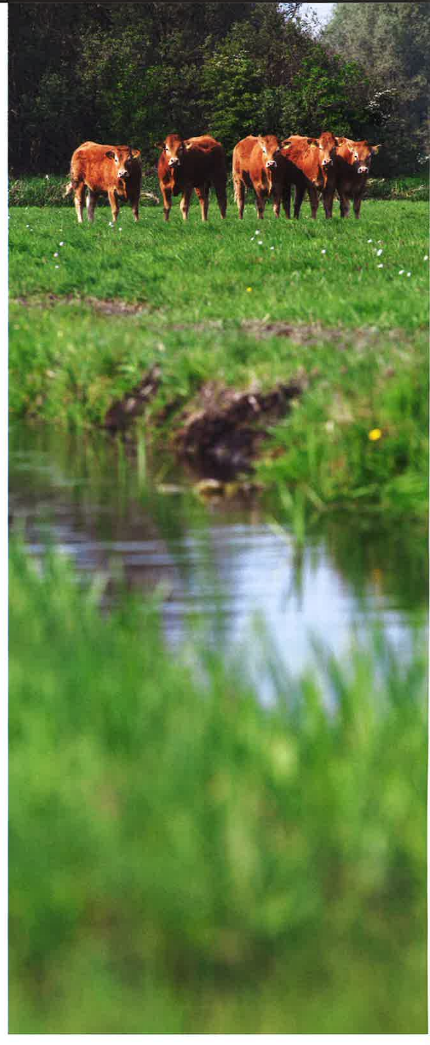
Agrariërs kunnen met hun machines, vee en kennis van het gebied de beheerkosten drukken.

Rust: "We ontwikkelen nu een visie hoe we het beheer beter kunnen organiseren. We willen met een kleiner aantal pachters gaan werken, maar dan wel intensiever. We stellen per deelgebied ambities op, en kijken hoeveel hectares van een type beheer daarbij passen. Dit werken we uit in een tekst, met plaatjes en foto's, waarmee we letterlijk de boer op gaan. We gaan op zoek naar agrariërs die aantoonbaar passen bij dit beleid." Ook Franke Hoekstra, accountmanager Noord-Holland van Staatsbosbeheer wil graag gebruik maken van natuurgericht ondernemerschap van agrariërs. "Een mooi voorbeeld vind ik het project waarin agrariërs samen met Landschap Noord-Holland verkennen of veenmos en lisdoddes op grond met zeer hoge waterstand vermarkt kunnen worden. Ook zelf experimenteren we met beheersvormen om samenwerking met agrariërs aantrekkelijker te maken. In het Guisveld huren we jongvee in van een aantal boeren uit de Beemster. De verzorging van het vee en het overzetten - het is hier vaarland waardoor de percelen alleen per boot zijn te bereiken - doen we zelf.