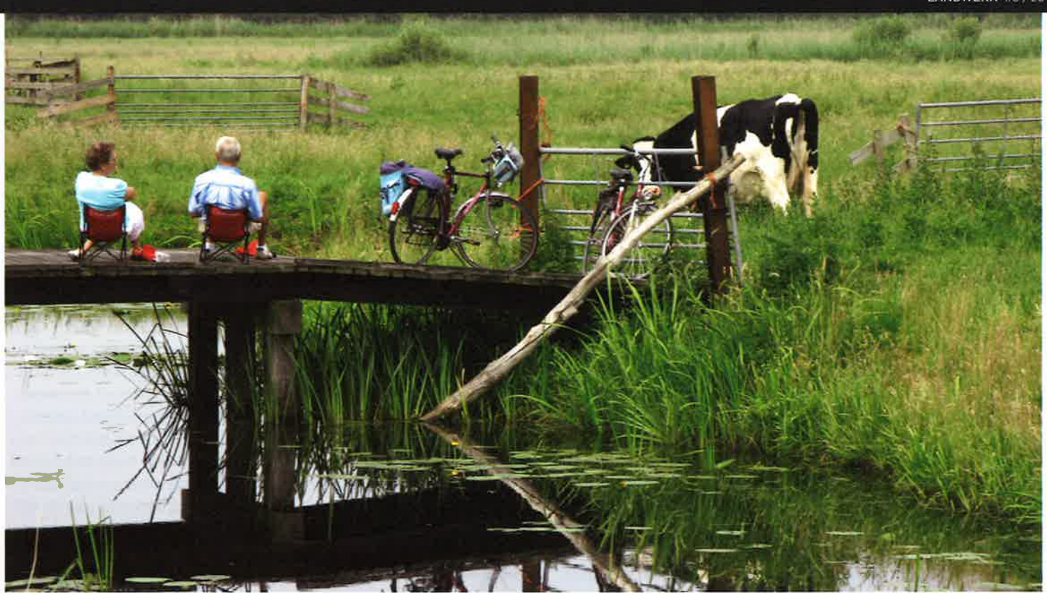
Steeds meer bedrijven richten zich op andere inkomsten door verbreding: zorglandbouw, recreatie, zelf producten verwerken en in eigen winkel verkopen, natuurbeheer.