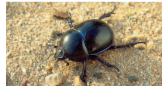
Mestkevers blijken gevoelig voor avermectines

Van de avermectines, vooral ivermectine, is bekend dat ze na uitscheiding in de mest een schadelijke werking op de mestfauna hebben. Bovendien breken de avermectines traag af en blijven ze langere tijd een schadelijke werking houden. Van ivermectine is bekend dat het maanden in de mest aanwezig kan blijven. Gedurende die tijd behoudt ivermectine ook zijn insecticidenwerking. Vooral mestkevers en vliegen blijken gevoelig voor avermectines te zijn. Mestkevers en vliegenlarven spelen een belangrijke rol bij de afbraak van mest. Daarnaast zijn zij een belangrijke voedselbron voor vogels en zoogdieren. Van regenwormen is bekend dat ze niet zo gevoelig voor ontwormingsmiddelen zijn.