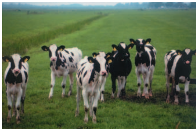
Verweid kalveren regelmatig naar schone percelen

De leverbot is een platworm die zich verspreidt via een zoetwaterslakje (de poelslak Limnaea trunculata ). Deze slak leeft alleen in ondiep water (minder dan 10 cm diep) en op plaatsen waar de bodem het grootste deel van het jaar nat is. Vee kan besmetting oplopen door het grazen op deze drassige plekken. Bij rundvee heeft besmetting met leverbot verminderde melkproductie en een verminderde groei en voederomzet tot gevolg. Schapen zijn gevoeliger voor leverbot en kunnen ernstige klachten ondervinden. Bovendien lopen schapen het gehele jaar buiten, waardoor de besmetting het hele jaar doorgaat.