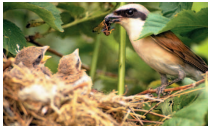
In sommige natuurgebieden zijn mestkevers een belangrijke voedselbron voor de grauwe klauwier.

In natuurgebieden is door de lage veedichtheid de besmettingskans gering en hoeft u voor rundvee niet preventief middelen te gebruiken. Voor paarden en schapen is dit wel raadzaam. Gebruik dan bij voorkeur geen middelen op basis van ivermectine. Middelen op basis van moxidectine hebben een minder groot milieu-effect en zijn ook effectief voor schapen en paarden.