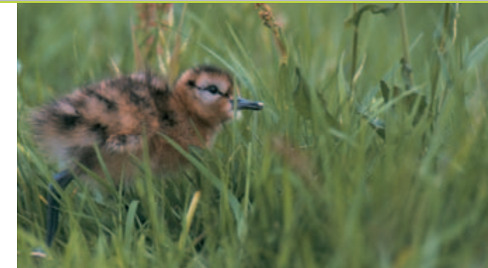
Jonge grutto's zoeken voedsel op aanwezige mestflatten

Grutto, Kievit, veldleeuwerik, gele kwikstaart en andere weidevogels eten vliegen, kevers en wormen uit de mest. Hierdoor worden ook zij aan ontwormingsmiddelen blootgesteld. De schadelijkheid van ontwormingsmiddelen voor weidevogels is nooit onderzocht. Een indirect effect als gevolg van het afnemen van de voedselvoorraad (insecten op de mest) is echter niet uit te sluiten. Vooral op het grootbrengen van de jongen zou dit effect kunnen hebben. Behandeld jongvee graast immers vooral op de wat verder van de